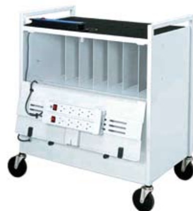
Pannello di accesso posteriore